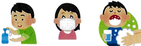
みんなで予防対策

検査の終期はワクチン効果や接種状況により、一律定め難いとの見解になっております。