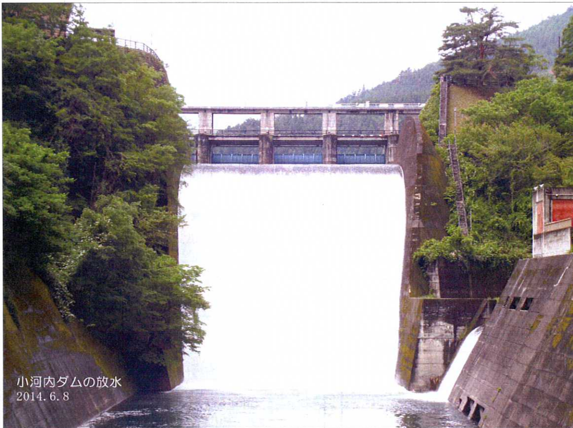
小河内ダムの放水 2014. 6. 8

〒198-0212 東京都西多摩郡奥多摩町氷川1099 TEL 0428-83-3932 FAX 0428-83-3706 URL http://web.futabakai.or.jp e-mail kinseien@futabakai.or.jp