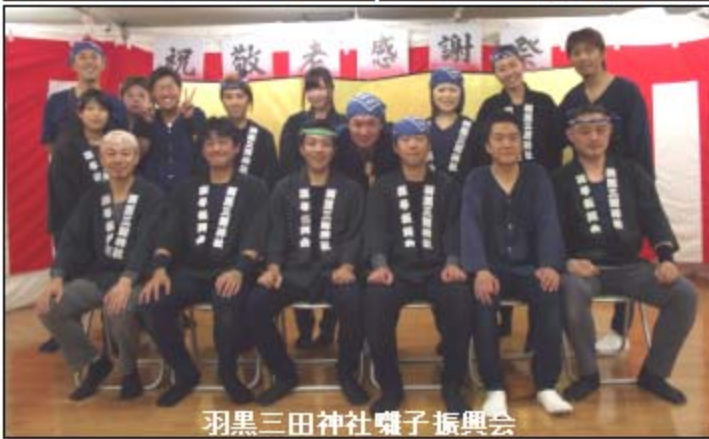
羽黒三田神社囃子振興会