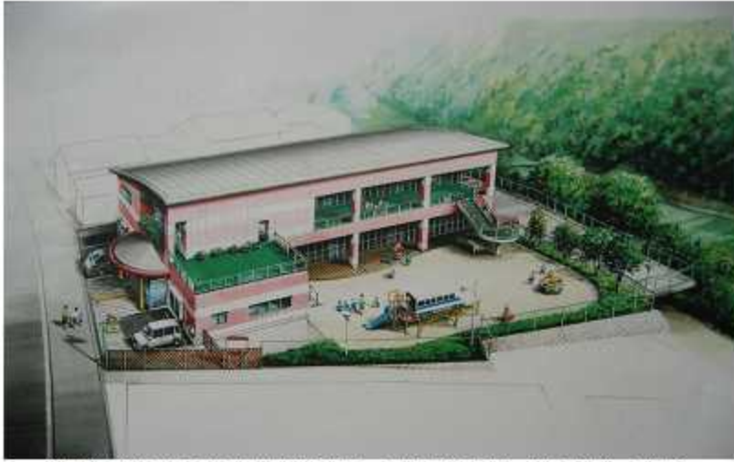
(社会福祉法人 双葉会 氷川保育園 完成予想図・㈱石井昌建築事務所)